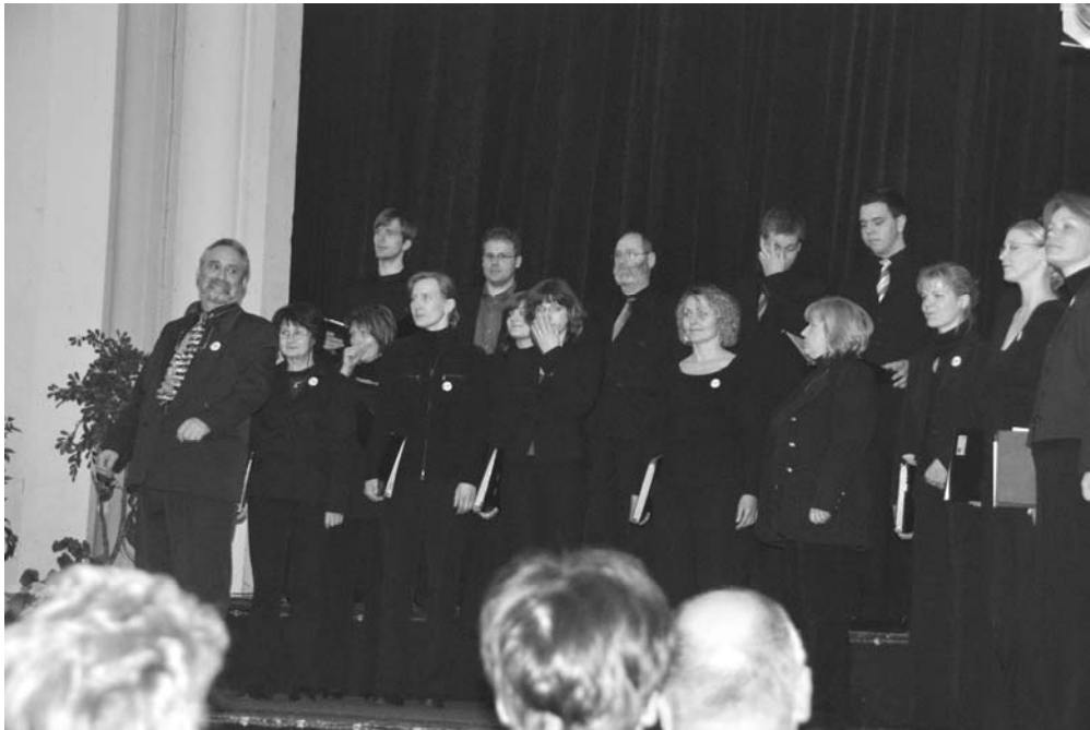
Kammerchor „Cantare continuo“, Wolgast

Achtung, neuer Termin: Die Anmeldung der Chöre des CMV zum Leistungssingen hat bis spätestens 30. April 2008 zu erfolgen.