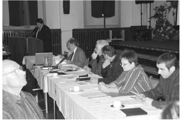
Das Präsidium hat Platz genommen...